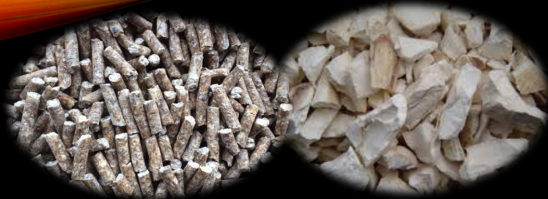
อุตสาหกรรมอาหารสัตว์