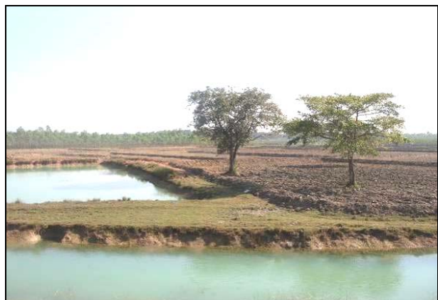
4-014 : ชุมชนบ้านท่าโขง