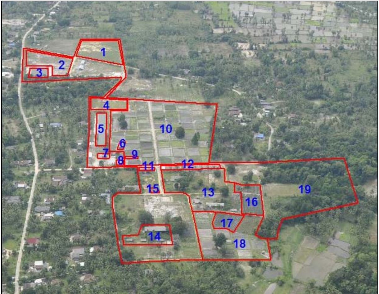
สัญลักษณ์แผนที่