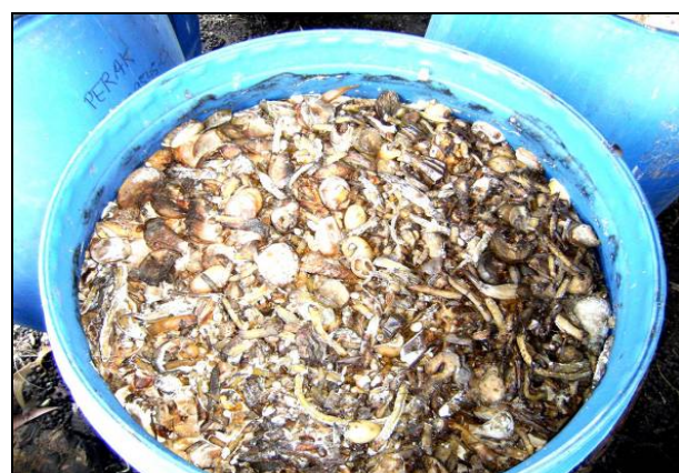
สาธิตการใช้ปุ๋ยอินทรีย์น้ำ