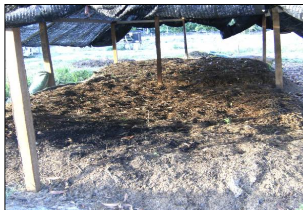
สาธิตการใช้ปุ๋ยหมัก