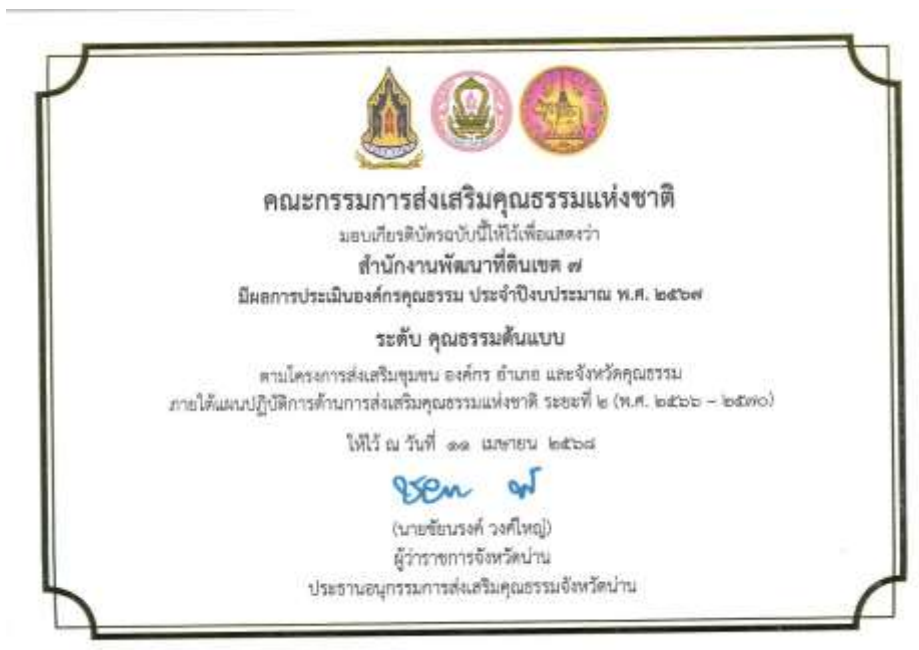
18. เกียรติบัตร “องค์กรคุณธรรมต้นแบบ” ประจำปี 2567 จาก คณะอนุกรรมการส่งเสริมคุณธรรมจังหวัดน่าน วันที่ 11 เมษายน 2568