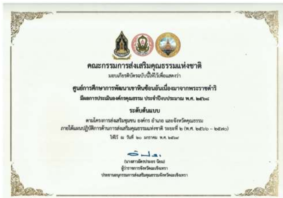
66. เกียรติบัตร “องค์กรคุณธรรมต้นแบบ” ประจำปีงบประมาณ พ.ศ. 2568 จาก คณะอนุกรรมการส่งเสริมคุณธรรมจังหวัดฉะเชิงเทรา วันที่ 20 มกราคม 2569