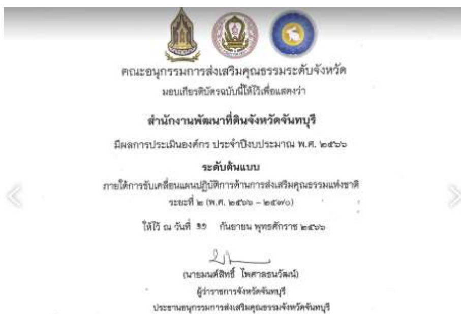
7. เกียรติบัตร “องค์กรคุณธรรมต้นแบบ” ประจำปีงบประมาณ พ.ศ. 2566 จาก คณะอนุกรรมการส่งเสริมคุณธรรมจังหวัดจันทบุรี วันที่ 11 กันยายน 2566