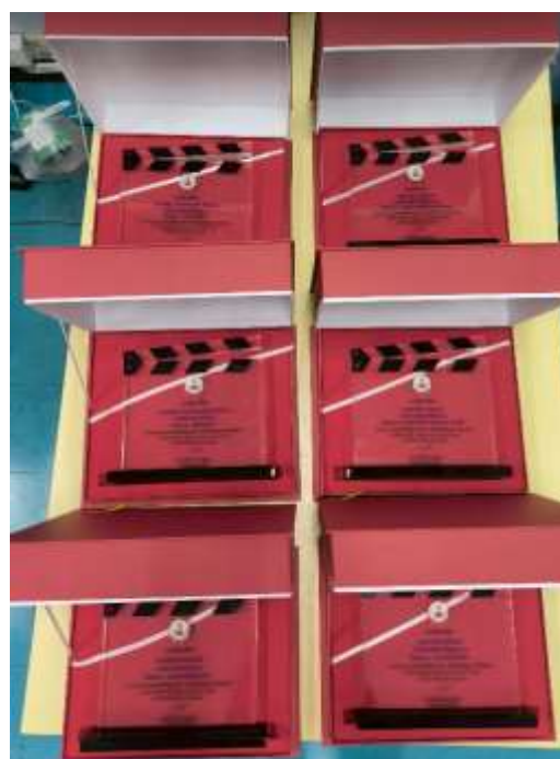
36 - 41 โล่รางวัลเชิดชูเกียรติ ชะนาการประกวดคลิปวิดีโอแนวคิด/วิธีแก้ไขปัญหาทางจริยธรรม ภายใต้หัวข้อ “ชาวดิน คนทำดี : Keep Up the Good Things” ประจำปีงบประมาณ พ.ศ.2568

จาก กรมพัฒนาที่ดิน วันที่ 23 พฤษภาคม 2568