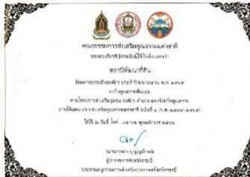
4. เกียรติบัตร “องค์กรคุณธรรมต้นแบบ” ประจำปีงบประมาณ พ.ศ. 2565 จาก คณะอนุกรรมการส่งเสริมคุณธรรมจังหวัดกระบี่ วันที่ 27 เมษายน 2566