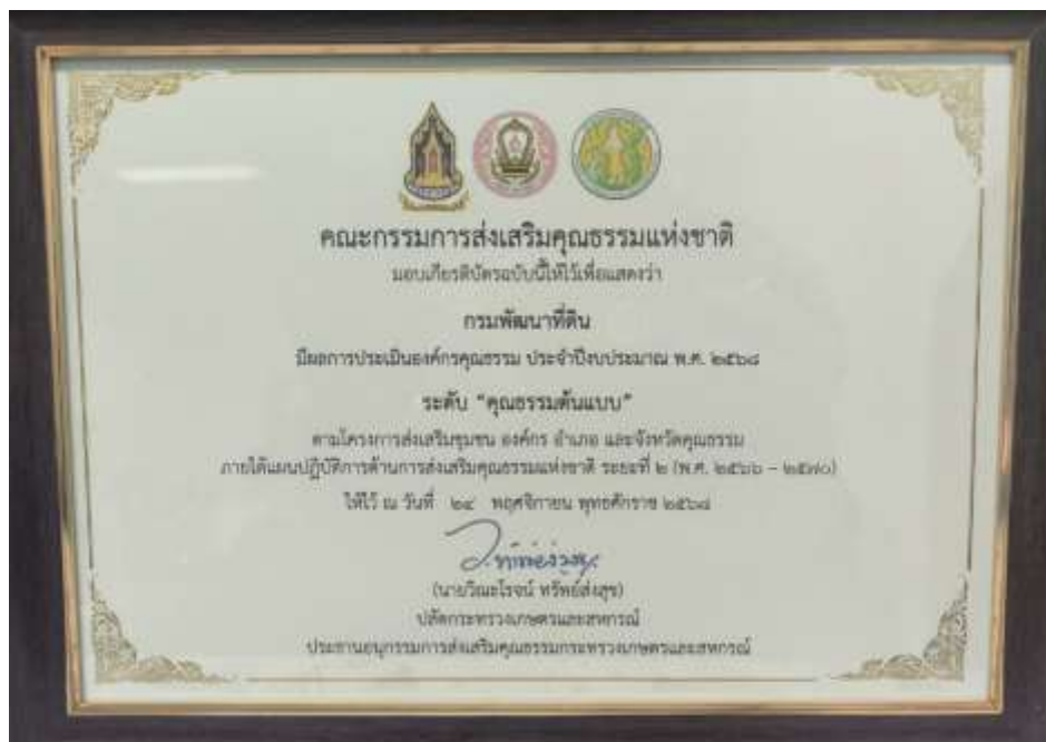
13. เกียรติบัตร “องค์กรคุณธรรมต้นแบบ” ประจำปี 2568 จาก คณะอนุกรรมการส่งเสริมคุณธรรม กระทรวงเกษตรและสหกรณ์ วันที่ 24 พฤศจิกายน 2568