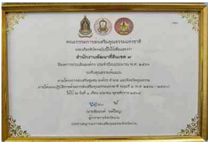
12. เกียรติบัตร “องค์การคุณธรรมต้นแบบ” ประจำปีงบประมาณ พ.ศ.2566 จาก คณะอนุกรรมการส่งเสริมคุณธรรมจังหวัดน่าน วันที่ 1 เมษายน 2567