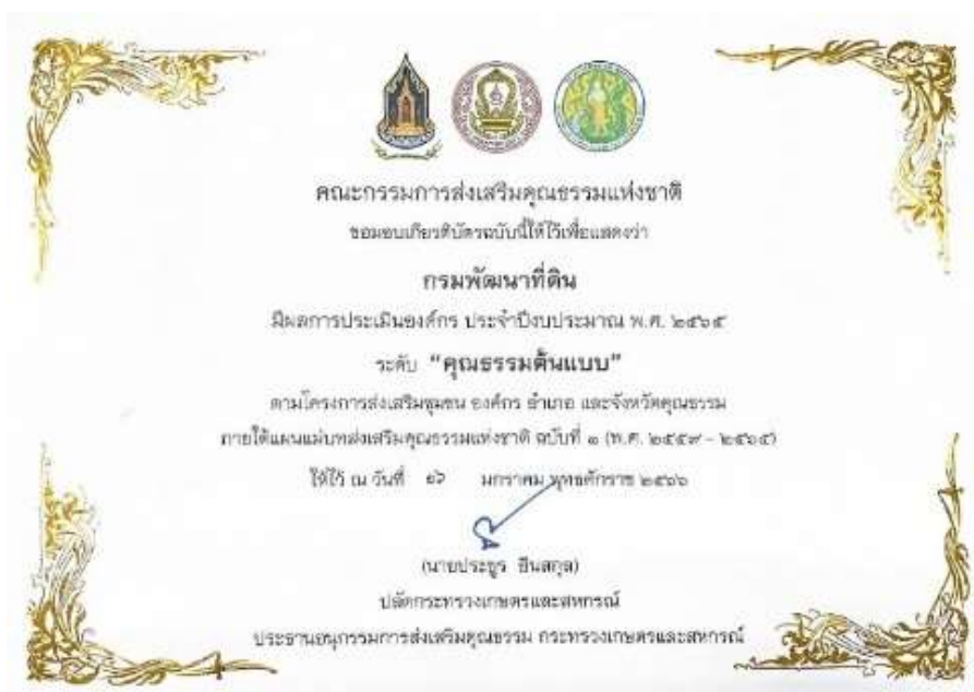
7. เกียรติบัตร “องค์กรคุณธรรมต้นแบบ” ประจำปี 2565 จาก คณะอนุกรรมการส่งเสริมคุณธรรม กระทรวงเกษตรและสหกรณ์ วันที่ 16 มกราคม 2566