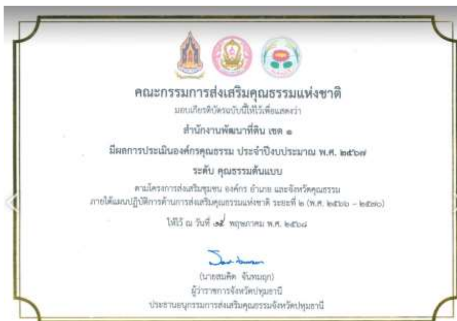
35. เกียรติบัตร “องค์กรคุณธรรมต้นแบบ” ประจำปีงบประมาณ พ.ศ. 2567 จาก คณะอนุกรรมการส่งเสริมคุณธรรมจังหวัดปทุมธานี วันที่ 15 พฤษภาคม 2568