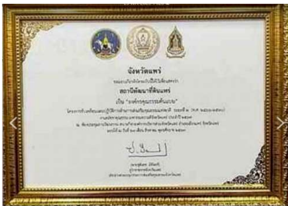
15. เกียรติบัตร “องค์กรคุณธรรมต้นแบบ” ประจำปีงบประมาณ พ.ศ. 2567 จาก คณะอนุกรรมการส่งเสริมคุณธรรมจังหวัดแพร่ วันที่ 28 สิงหาคม 2567