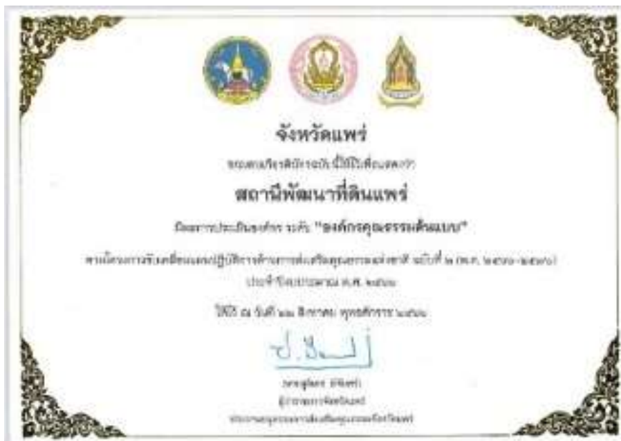
5. เกียรติบัตร “องค์กรคุณธรรมต้นแบบ” ประจำปีงบประมาณ พ.ศ. 2566 จาก คณะอนุกรรมการส่งเสริมคุณธรรมจังหวัดแพร่ วันที่ 22 สิงหาคม 2566