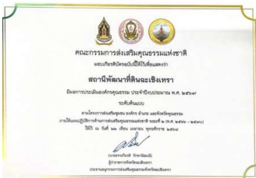
19. เกียรติบัตร “องค์กรคุณธรรมต้นแบบ” ประจำปีงบประมาณ พ.ศ. 2567 จาก คณะอนุกรรมการส่งเสริมคุณธรรมจังหวัดฉะเชิงเทรา วันที่ 22 เมษายน 2568