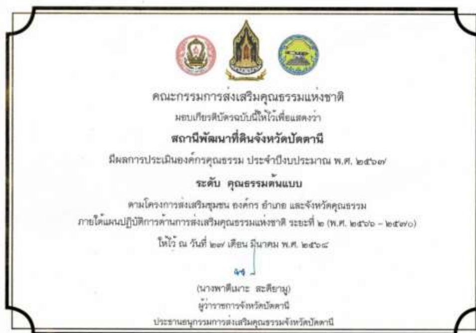
16. เกียรติบัตร “องค์กรคุณธรรมต้นแบบ” ประจำปีงบประมาณ พ.ศ. 2567 จาก คณะอนุกรรมการส่งเสริมคุณธรรมจังหวัดปัตตานี วันที่ 27 มีนาคม 2568