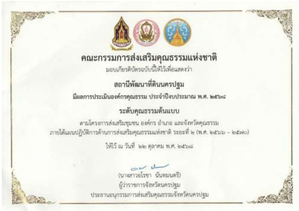
44. เกียรติบัตร “องค์กรคุณธรรมต้นแบบ” ประจำปีงบประมาณ พ.ศ. 2568 จาก คณะอนุกรรมการส่งเสริมคุณธรรมจังหวัดนครปฐม วันที่ 22 ตุลาคม 2568