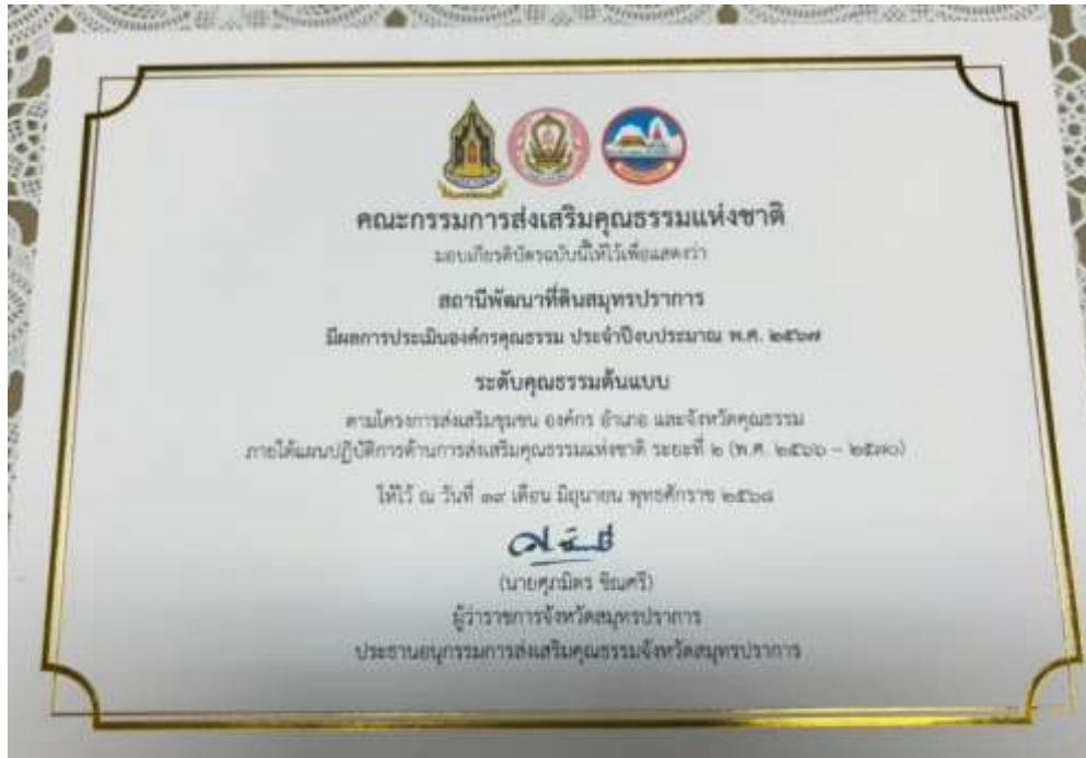
42. เกียรติบัตร “องค์กรคุณธรรมต้นแบบ” ประจำปีงบประมาณ พ.ศ. 2567 จาก คณะอนุกรรมการส่งเสริมคุณธรรมจังหวัดสมุทรปราการ วันที่ 19 มิถุนายน 2568