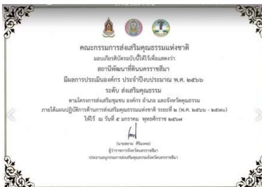
9. เกียรติบัตร “องค์กรคุณธรรม ระดับ ส่งเสริมคุณธรรม” ประจำปีงบประมาณ พ.ศ. 2566 จาก คณะอนุกรรมการส่งเสริมคุณธรรมจังหวัดนครราชสีมา วันที่ 5 มกราคม 2567