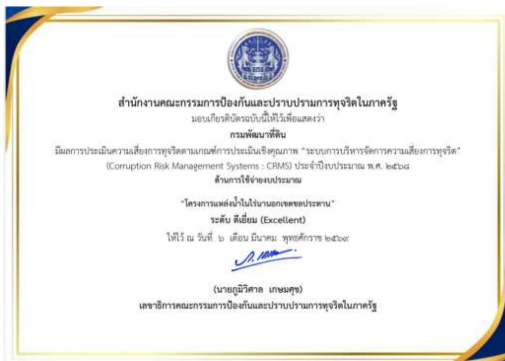
14. เกียรติบัตร กรมพัฒนาที่ดินมีผลการประเมินความเสี่ยงตามเกณฑ์การประเมินเชิงคุณภาพ “ระบบการบริหารจัดการความเสี่ยงการทุจริต” (Corruption Risk Management Systems : CRMS) ประจำปีงบประมาณ พ.ศ. 2568 ระดับ ดีเยี่ยม (Excellent) ด้านการใช้จ่ายงบประมาณโครงการแหล่งน้ำในไร่นานอกเขตชลประทาน จาก เลขาธิการคณะกรรมการป้องกันและปราบปรามการทุจริตในภาครัฐ วันที่ 6 มีนาคม 2569