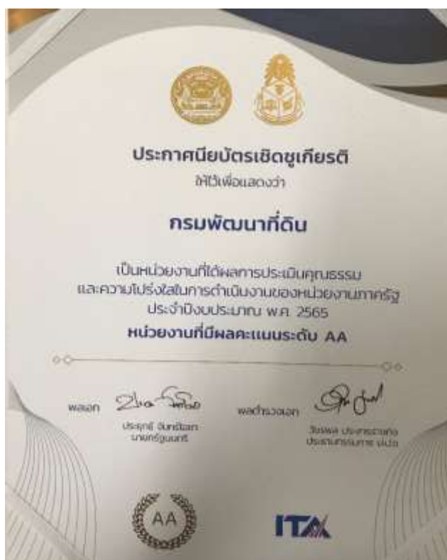
8. ประกาศนียบัตรเชิดชูเกียรติ “หน่วยงานที่มีผลคะแนนระดับ AA” หน่วยงานที่มีผลการประเมินคุณธรรมและความโปร่งใสในการดำเนินงานของหน่วยงาน ภาครัฐ (ITA) ประจำปี 2565 จาก สำนักงาน ป.ป.ช.