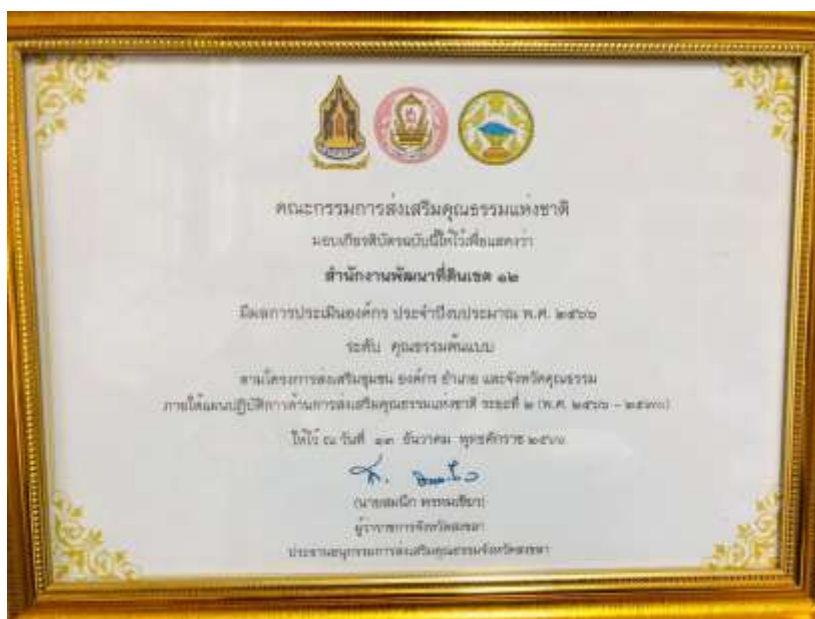
8. เกียรติบัตร “องค์กรคุณธรรมต้นแบบ” ประจำปีงบประมาณ พ.ศ. 2566 จาก คณะอนุกรรมการส่งเสริมคุณธรรมจังหวัดสงขลา วันที่ 13 ธันวาคม 2566