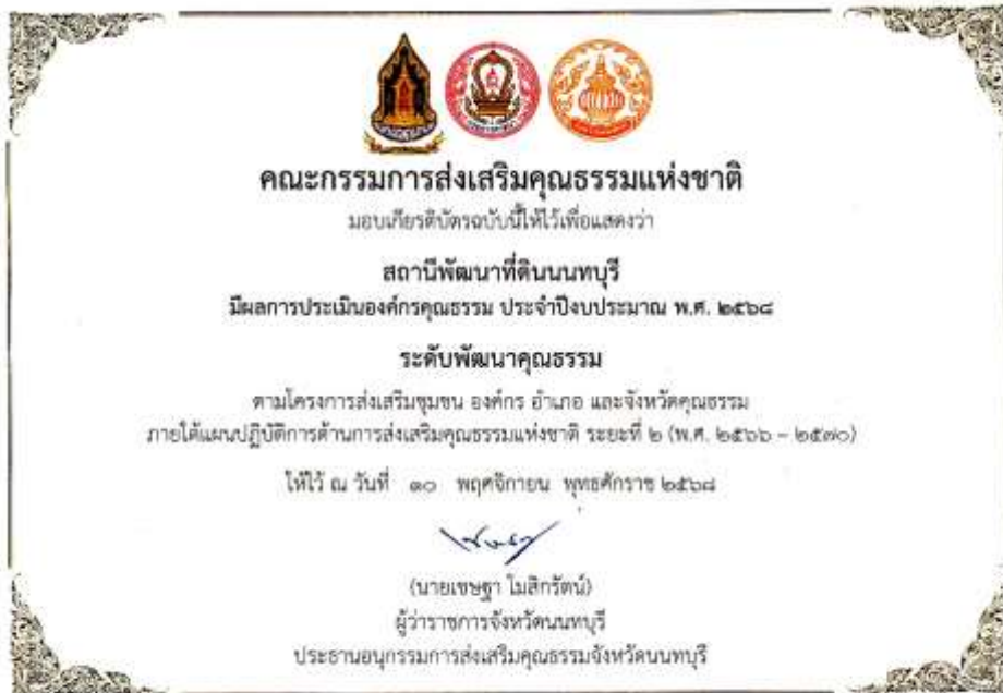
45. เกียรติบัตร “องค์กรคุณธรรม ระดับ พัฒนาคุณธรรม” ประจำปีงบประมาณ พ.ศ. 2568 จาก คณะอนุกรรมการส่งเสริมคุณธรรมจังหวัดนพนบุรี 10 พฤศจิกายน 2568