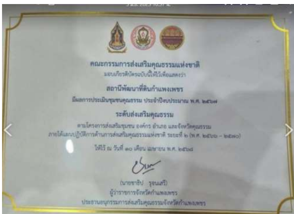
17. เกียรติบัตร “องค์กรคุณธรรมต้นแบบ” ประจำปีงบประมาณ พ.ศ. 2567 จาก คณะอนุกรรมการส่งเสริมคุณธรรมจังหวัดกำแพงเพชร วันที่ 10 เมษายน 2568