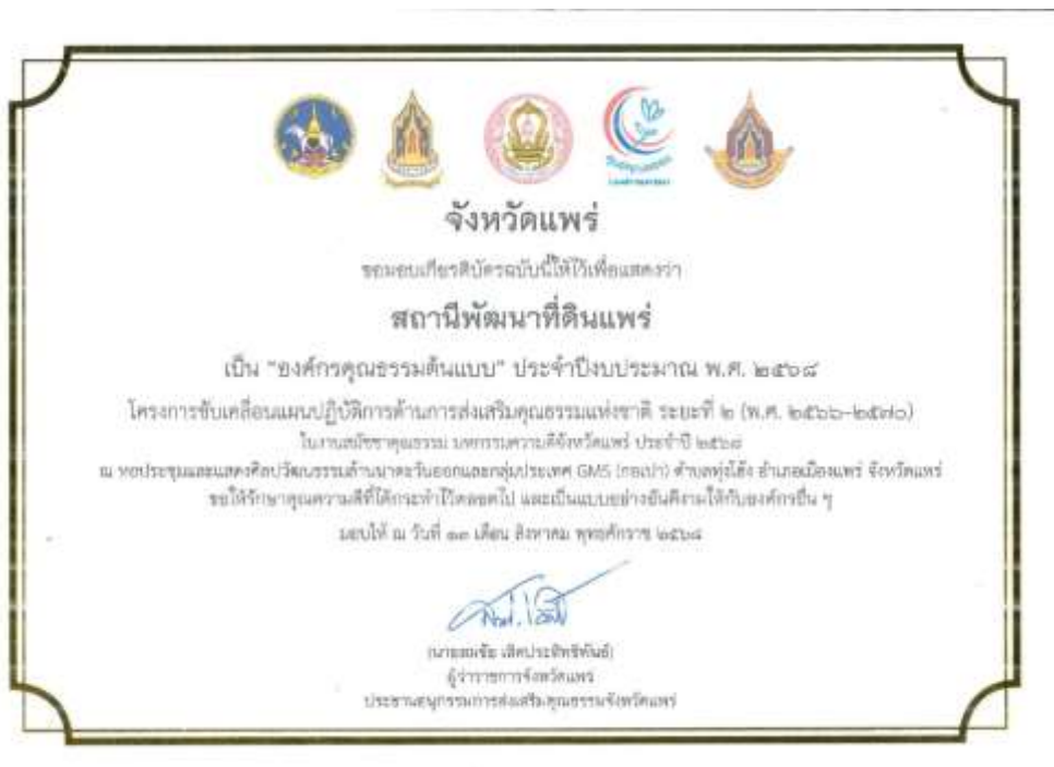
43. เกียรติบัตร “องค์กรคุณธรรมต้นแบบ” ประจำปีงบประมาณ พ.ศ. 2568 จาก คณะอนุกรรมการส่งเสริมคุณธรรมจังหวัดแพร่ วันที่ 13 สิงหาคม 2568