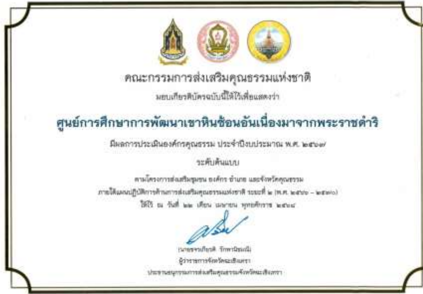
20. เกียรติบัตร “องค์กรคุณธรรมต้นแบบ” ประจำปีงบประมาณ พ.ศ. 2567 จาก คณะอนุกรรมการส่งเสริมคุณธรรมจังหวัดฉะเชิงเทรา วันที่ 22 เมษายน 2568