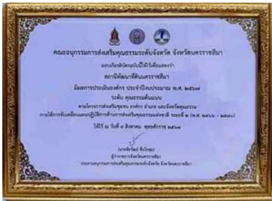
14. เกียรติบัตร “องค์กรคุณธรรมต้นแบบ” ประจำปีงบประมาณ พ.ศ. 2567 จาก คณะอนุกรรมการส่งเสริมคุณธรรมจังหวัดนครราชสีมา วันที่ 9 สิงหาคม 2567