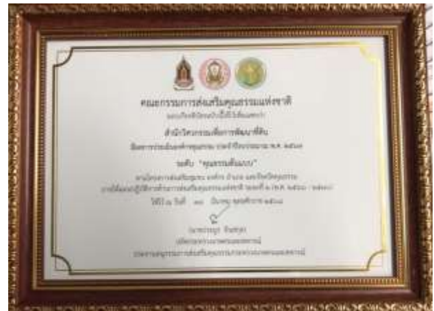
21 -34 เกียรติบัตร องค์กรคุณธรรมต้นแบบ ประจำปีงบประมาณ พ.ศ.2567 หน่วยงาน ส่วนกลาง 14 หน่วยงาน จาก คณะอนุกรรมการส่งเสริมคุณธรรม กระทรวงเกษตรและสหกรณ์ วันที่ 18 มีนาคม 2568