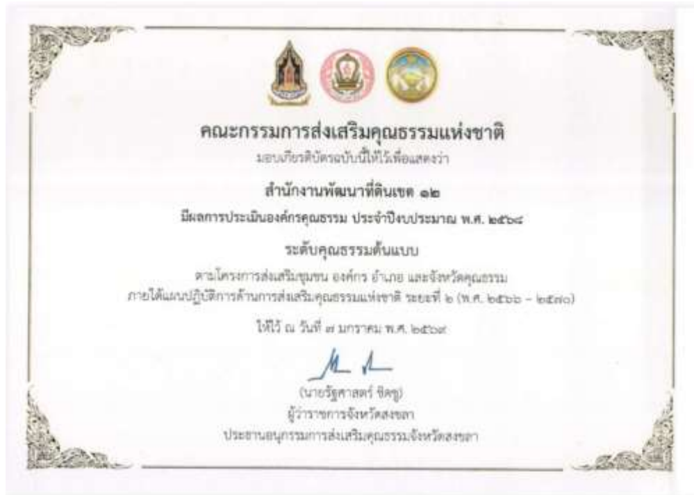
65. เกียรติบัตร “องค์กรคุณธรรมต้นแบบ” ประจำปีงบประมาณ พ.ศ. 2568 จาก คณะอนุกรรมการส่งเสริมคุณธรรมจังหวัดสงขลา วันที่ 7 มกราคม 2569