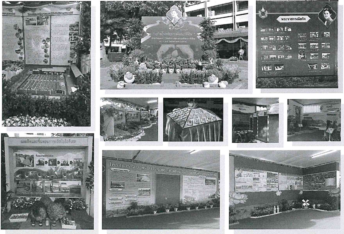
นิทรรศการ “60 พรรษา เจ้าฟ้าแห่งการพัฒนาที่ดิน”