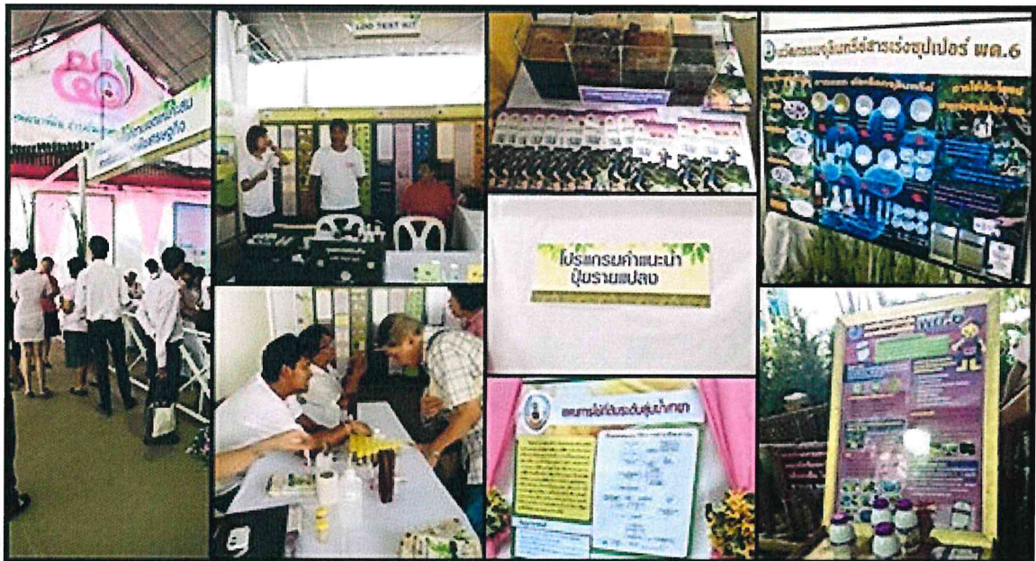
การแสดงผลงานวิชาการ