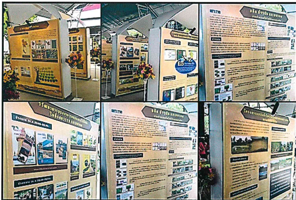
นิทรรศการ กิ่งศตวรรษพัฒนาที่ดินกับอนาคตในทศวรรษหน้า