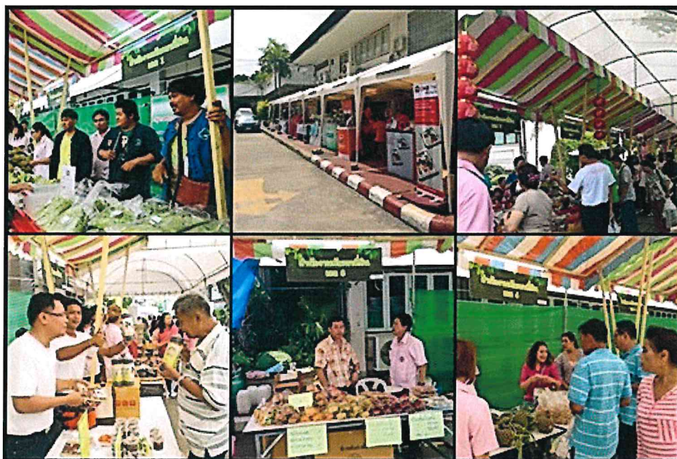
ตลาดนัดผลิตภัณฑ์ทางการเกษตรและร้านค้าต่างๆ