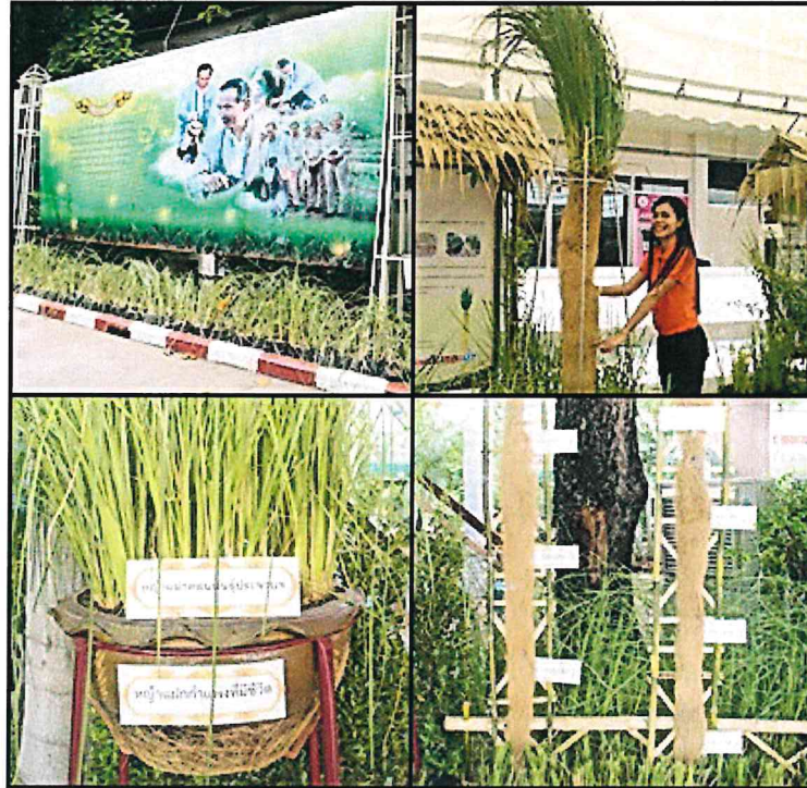
นิทรรศการ ผลงานการประกวดหญ้าแฝก