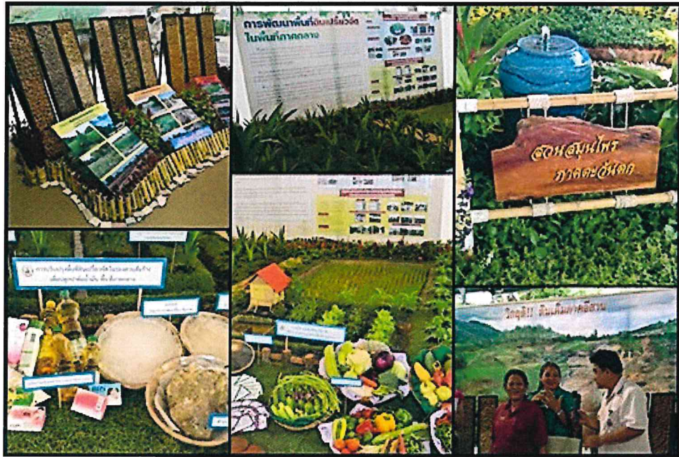
นิทรรศการ เทคโนโลยีพัฒนาที่ดิน 4 ภาค