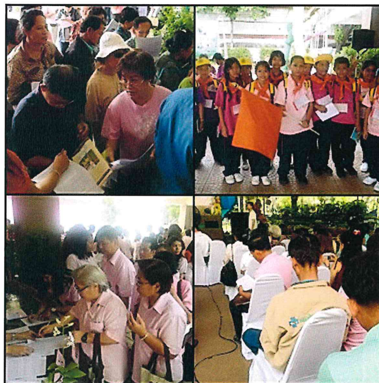
กลุ่มตัวอย่างที่ใช้ในการประเมินผลการจัดงาน