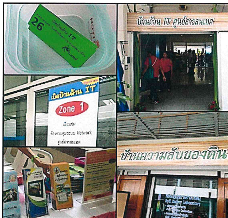
เปิดบ้านพัฒนาที่ดิน