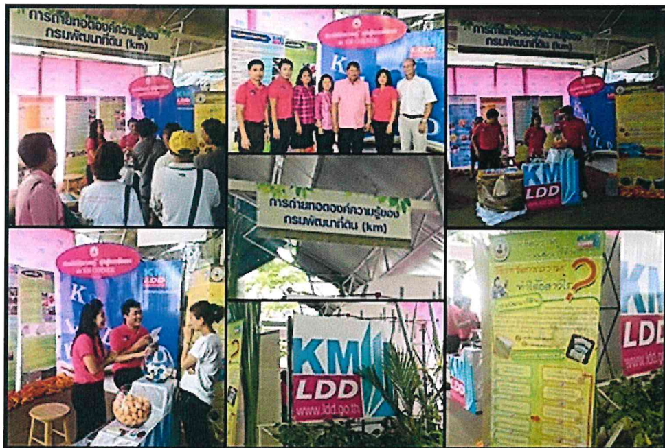
โครงการถ่ายทอดองค์ความรู้ของกรมพัฒนาที่ดิน (KM)